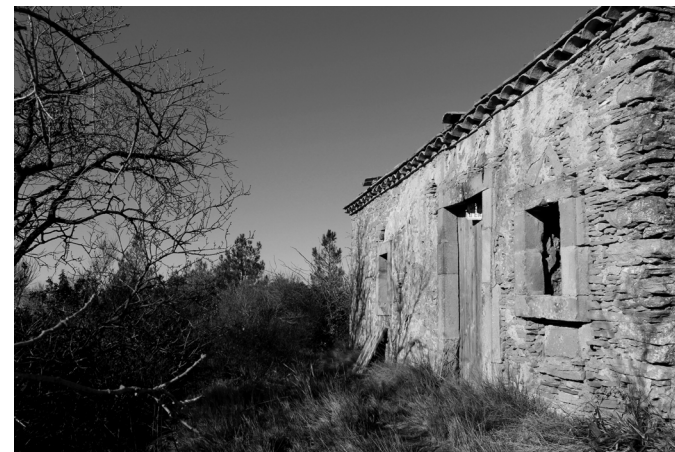
Loge inventoriée vers Cabanes et Pech Anges

Au-delà de son rapport au paysage, fortement marqué, il témoigne également de pratiques sociales et culturelles en partie disparues, mais dont leur présence dans le paysage en rappelle le souvenir.