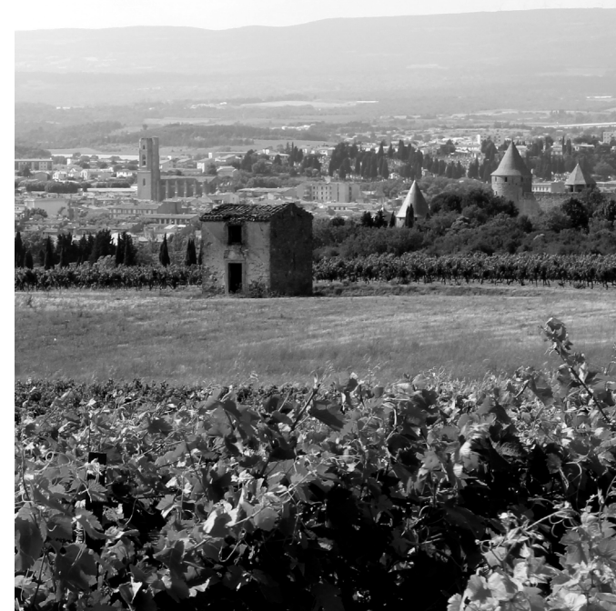
Une covisibilité souvent rencontrée concernant les loges de vignes vis-à-vis du monument Unesco.

Aussi, en complément, le Syndicat Mixte de l'Opération Grand Site de la Cité de Carcassonne souhaite développer une communication pédagogique sur le petit patrimoine bâti rural par l'édition de monographies thématiques visant à sensibiliser la population sur un patrimoine à révéler.